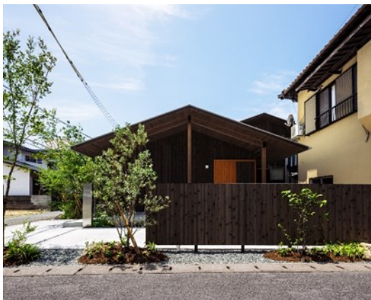
<第33回住宅の部 大賞「浦志の家」>