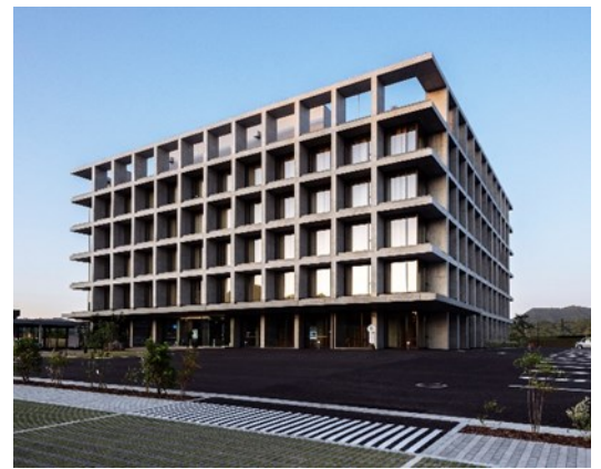
<第33回一般建築の部 大賞「嘉麻市庁舎」>